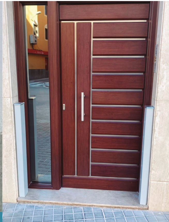
Guía con "cubre guías"