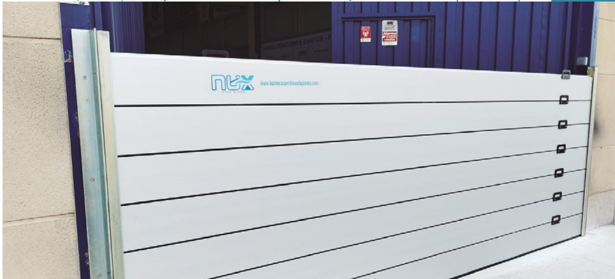
Tamaño: 5,25 x 1,56 m | Colocación: empresa de Quart de Poblet (Valencia) (vista interior)