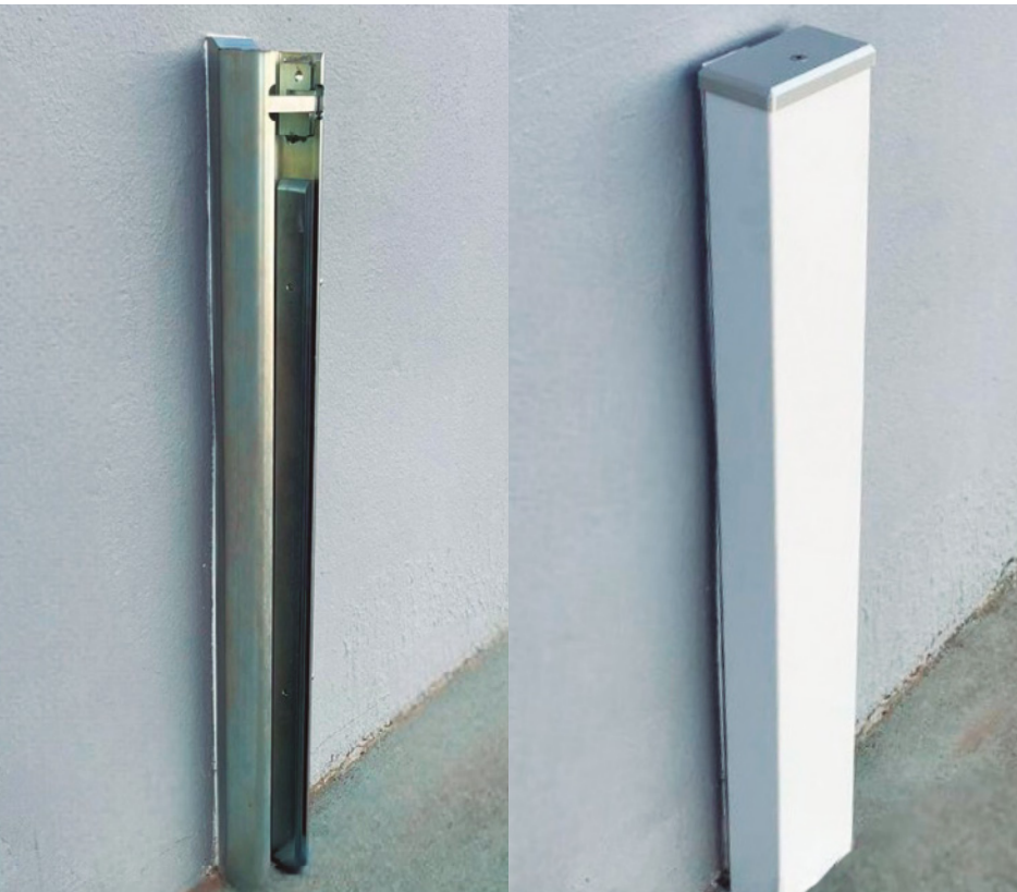
Guía sin "cubre guías"