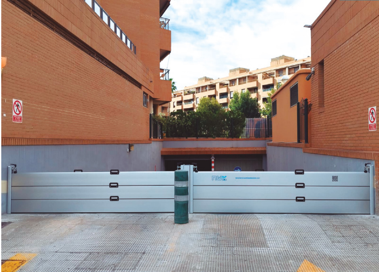
Tamaño: 9 x 0,68 m | Colocación: parking edificio de oficinas