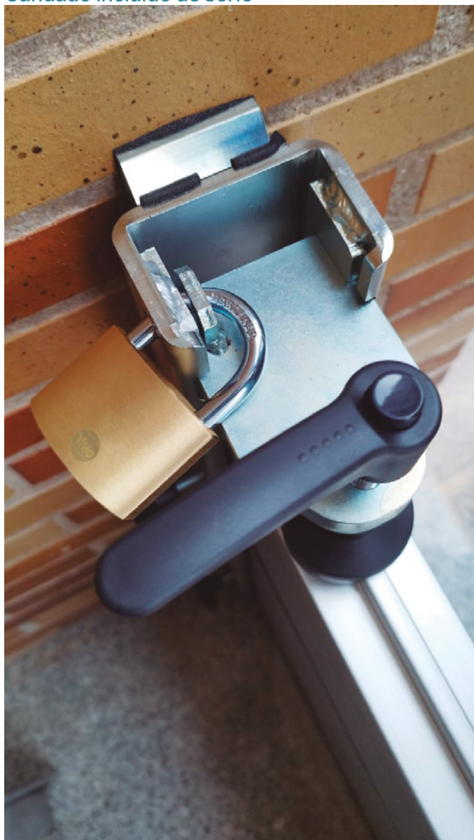
Candado incluido de serie